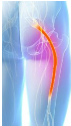
Névralgie, douleur localisée sur la voie d'un nerf sensitif, au niveau des racines ou des ramifications

La névralgie est le terme utilisé pour désigner une douleur localisée sur la voie d'un nerf sensitif, soit au niveau des racines ou sur les ramifications. Suivant le cas, elle peut être ressentie spontanément ou à l'attouchement, aiguë ou chronique, diffuse ou localisée, intermittente ou continue. Le type de douleur peut, en outre, varier d'un cas à l'autre et s'accompagner de symptômes différents suivant la région du corps concernée.