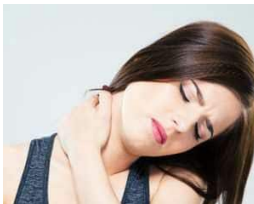
Manifestations de la névralgie : douleurs passagères, intermittentes ou continues, nocturnes, diurnes, locales ou diffuses, ...